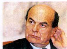
> Pierluigi Bersani

Gentile avvocato, non sono in grado di soppesare tutti i risvolti della questione ma, a occhio, mi sembra un'ottima proposta. Darebbe un contributo serio alla liberalizzazione dei servizi professionali. Sarebbe interessante sapere cosa ne pensa il ministro Bersani.